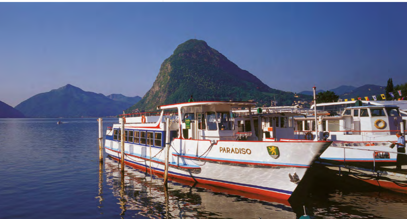
NAVIGATION SUR LE LAC DE LUGANO

niveau telles que Lugano Festival, manifestations de divertissement pour les familles telles que Noël sur la place, Pâques en ville ou la Fête d'automne, ne sont que quelques exemples du vaste programme d'activités dont on peut profiter en venant visiter Lugano. Les amateurs d'art, de sculpture et d'architecture pourront visiter les musées d'art de la ville et les magnifiques églises romanes et baroques disséminées dans toute la région. Juste aux portes de la ville, une myriade de sentiers conduisent à travers bois vers des localités pittoresques telles que Gandria, situé au bord du lac Ceresio, ou Brè accroché au flanc du mont homonyme. Pour les randonneurs plus exigeants, le Mont Lema, le