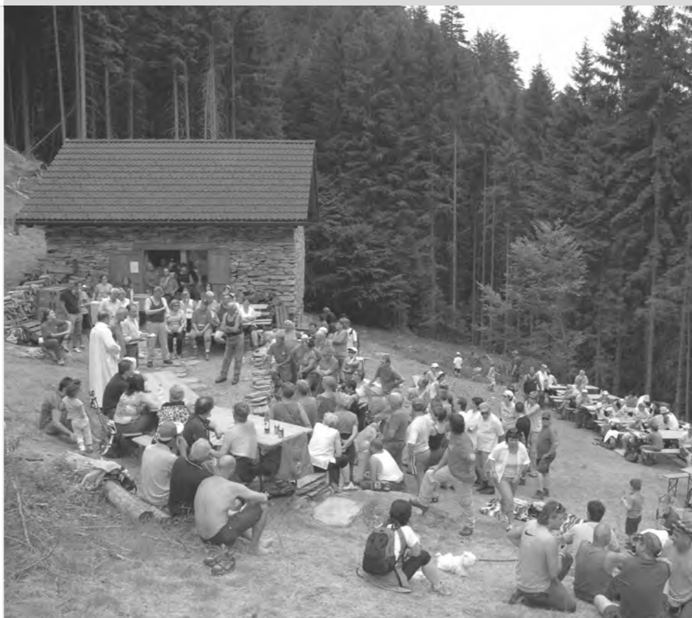
INAUGURAZIONE TECC STEVAN IN VAL D'AMBRA