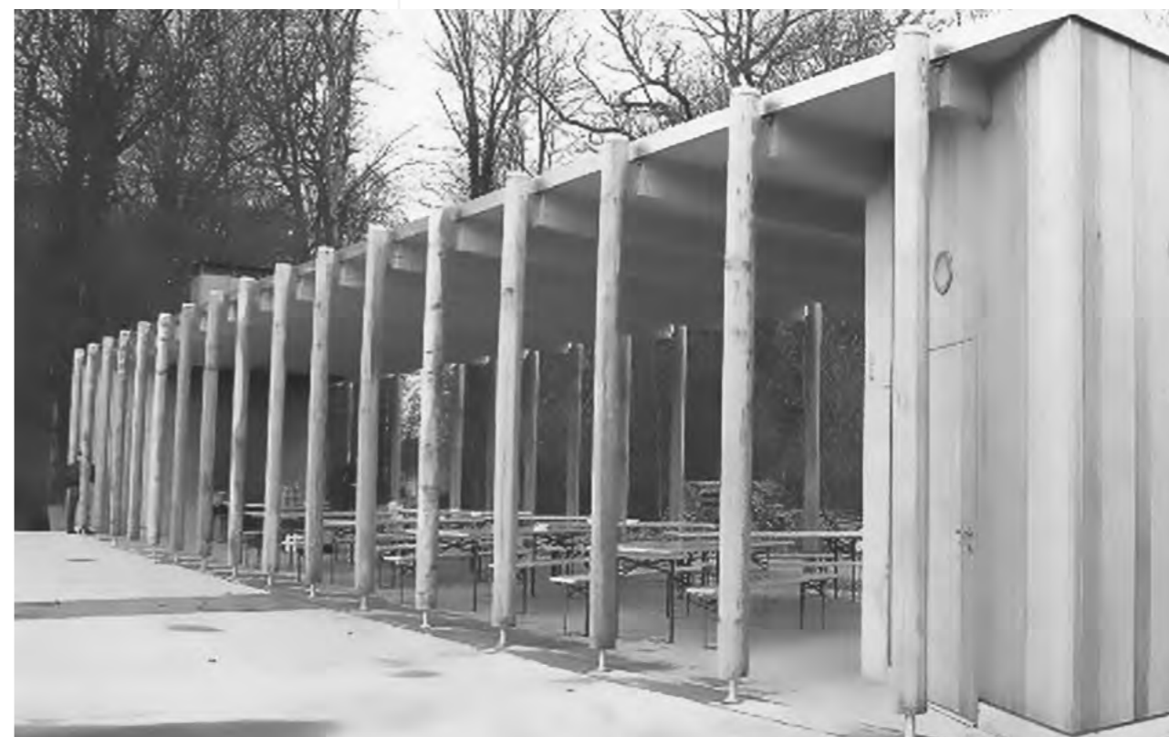
UNTERSTAND DER WILDSAUENHÜTTE

Höhe Stuttgart, der Trinkwasserspeicher. Dementsprechend umfangreich ist die Ausrüstung. In grossen Hallen findet man Ölwehrfahrzeuge, Materialwagen mit Tauchausrüstungen und eine Werkstatt für die Unterhaltsarbeiten. Grosse Aufmerksamkeit schenken wir den 4 Polizeibooten und speziell dem neusten Schiff «TG 3». Zwei nebeneinander liegende 6 Zylinder Turbodieselmotoren treiben je eine Schraube an.