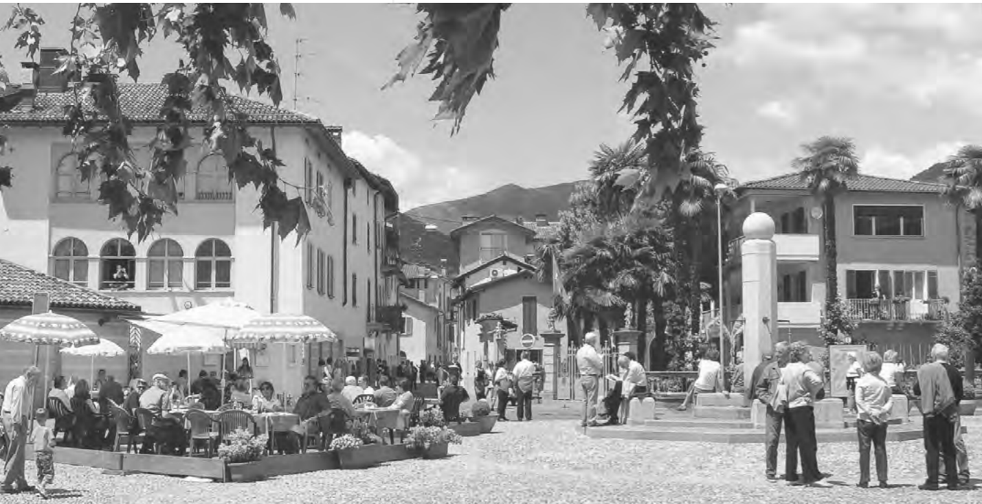
DER DIREKT AM SEE GELEGENE DORF- PLATZ VON CASLANO, DIE PIAZZA LAGO

Festival, musikalische Darbietungen auf allerhöchstem Niveau, wie z.B. das Lugano Festival, Familienveranstaltungen wie Weihnachten auf der Piazza, Ostern in der Stadt oder das Herbstfest sind nur einige Beispiele aus dem riesigen Angebot an Aktivitäten, aus denen Sie bei einem Besuch in Lugano wählen können. Die Liebhaber von Kunst, Bildhauerei und Architektur können die Kunstmuseen der Stadt und die eindrucksvollen romanischen und barocken Kirchen besuchen, die in der gesamten Region zu finden sind. Gleich vor der Stadt verzweigen sich unzählige Wanderwege, die durch beeindruckende Wälder und zu pittoresken Orten führen, wie z.B. Gandria an den Ufern des Luganer Sees oder Brè am Hängen des gleichnamigen Bergs. Besonders anspruchsvollen