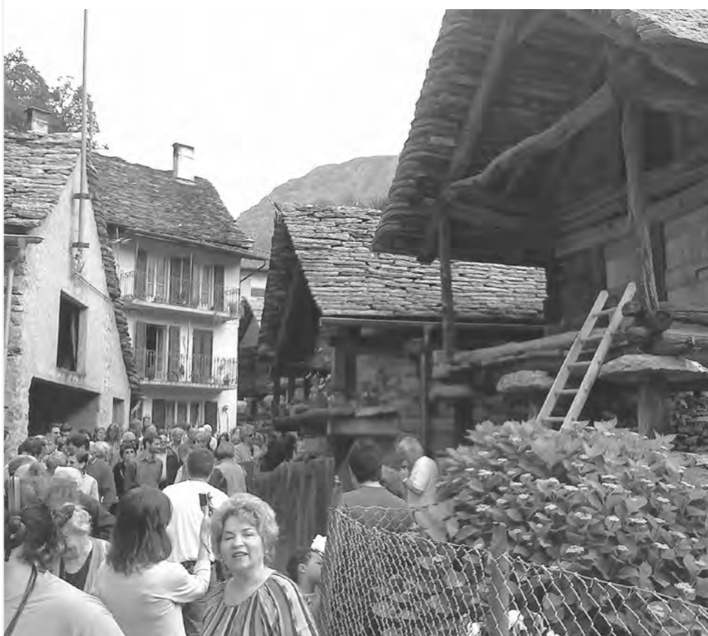
RESTAURO TORBA DI MOGHEGNO, VALLE MAGGIA