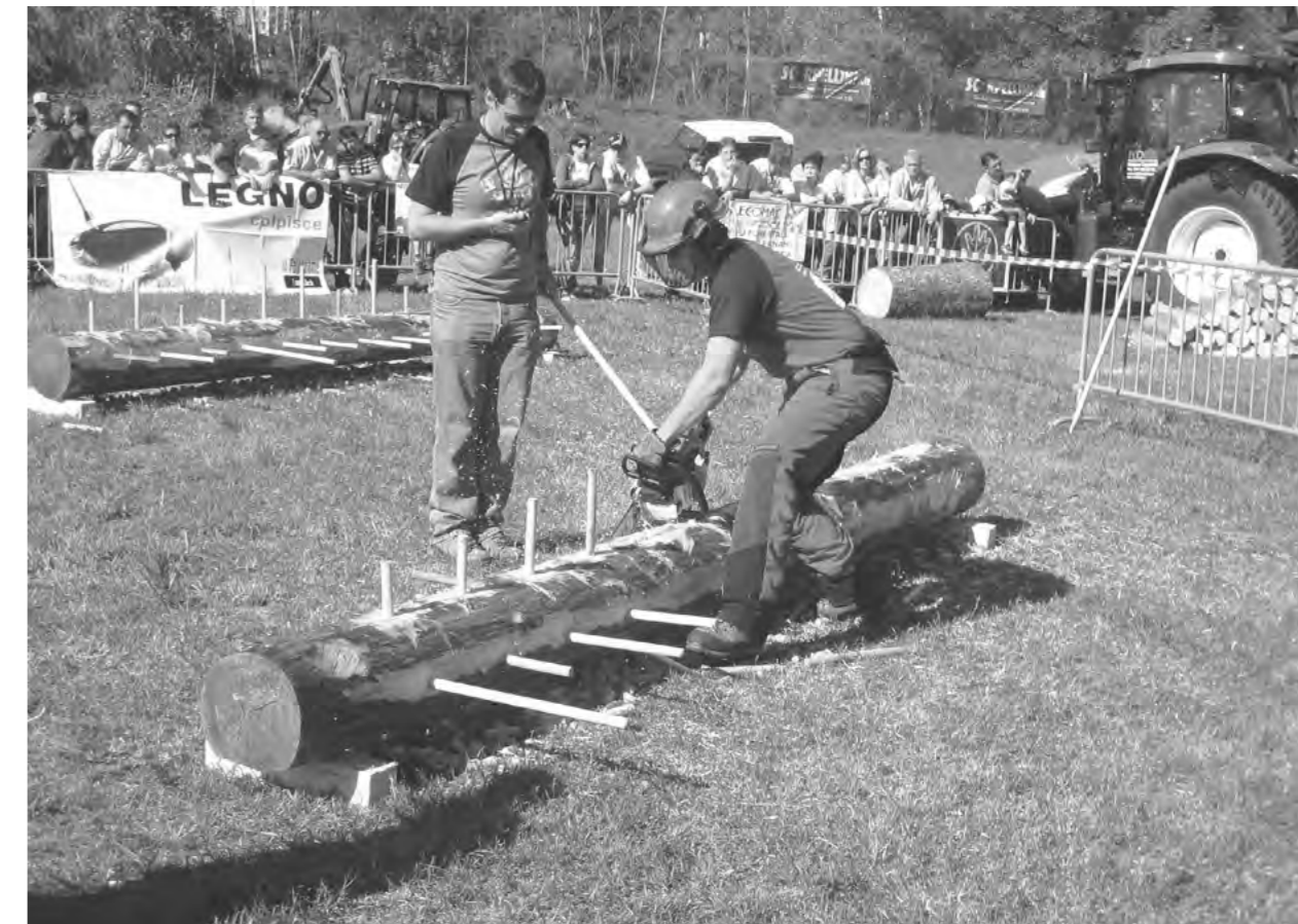
IMMAGINE: 1-2 PENTATLON DEL BOSCAIOLO

Nelle immagini, più che nelle parole, la tradizione di quanto di buono sono in grado di proporre i Patrizi oggi non solo nel rispetto di quanto trasmessoci ma soprattutto in visione prospettica futura per la cura del nostro splendido territorio. ■