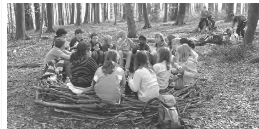
MÄRLIWALD FÜR DIE KINDER

FÜR WEITERE AUSKÜNFTE: DIE HOMEPAGE WWW.WALDTAGE-SO.CH ORIENTIERT IMMER AKTUELL ÜBER DEN ANLASS!