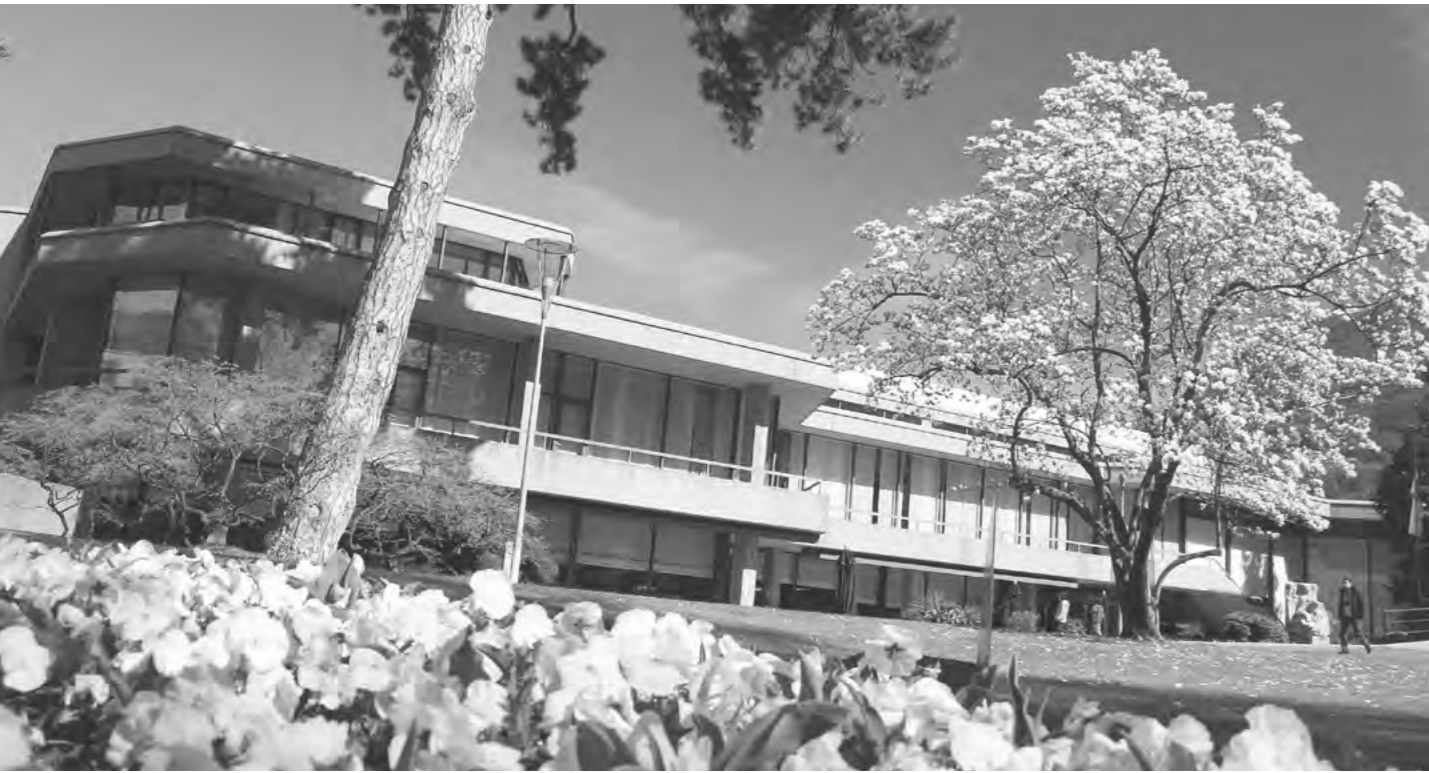
PALAZZO DEI CONGRESSI DI LUGANO

Natale in Piazza, Paqua in città o la Festa d'Autunno, sono solo alcuni esempi del vasto panorama di attività di cui approfittare durante una visita a Lugano. Gli amanti dell'arte, della scultura e dell'architettura, invece, possono visitare i musei d'arte della città e le splendide chiese, da quelle romaniche a quelle barocche, disseminate per tutta la regione. Appena fuori dal centro cittadino si diramano una miriade di sentieri che portano, attraversando magnifici boschi, a località pittoresche come Gandria, in riva al Ceresio, o Brè, abbarbicato sull'omonimo monte. Per gli escursionisti più esigenti il Monte Lema, il Tamaro, il