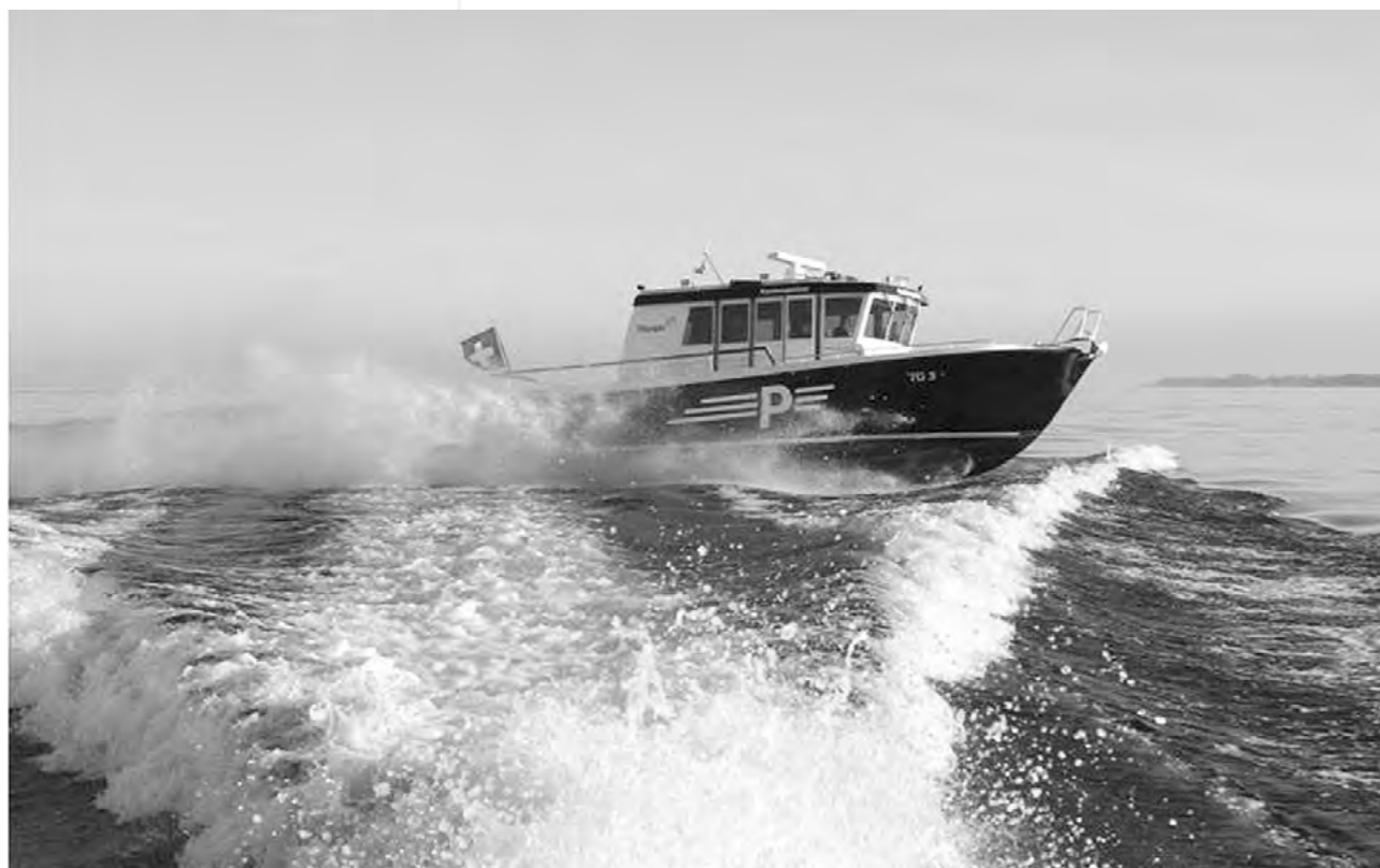
EIN POLIZEIBOOT IN AKTION