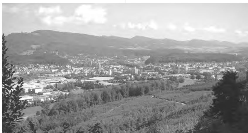
GELÄNDE DER WALDTAGE

vitäten sowie das Schulprogramm. Neben vielem anderem muss auch der Betrieb der Waldbeizen geplant, das Verkehrs- und Sicherheitskonzept erarbeitet und der Personaleinsatz geregelt werden.